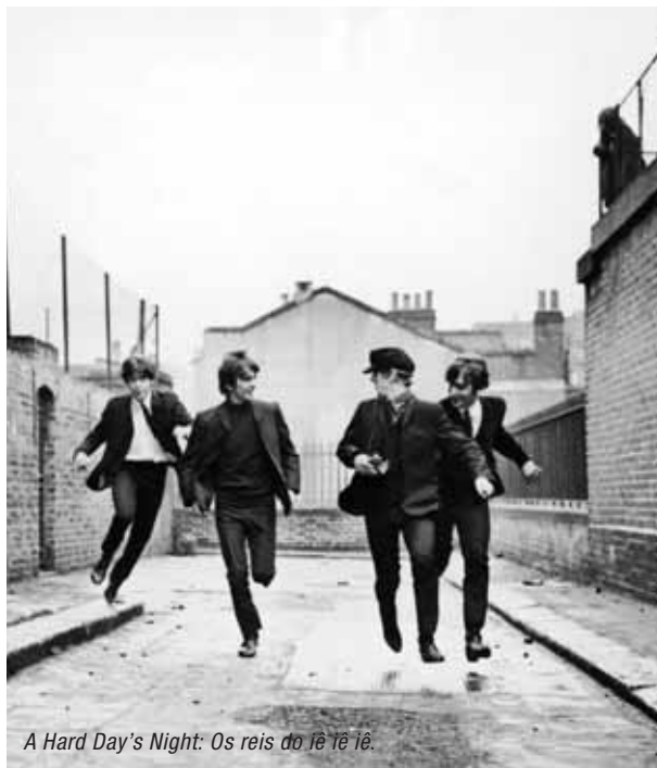
A Hard Day's Night: Os reis do iê iê iê.

Como bons cinéfilos, seguimos vivendo o presente, sem nunca esquecer o passado da sétima arte. É só se programar!