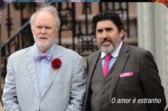
O amor é estranho