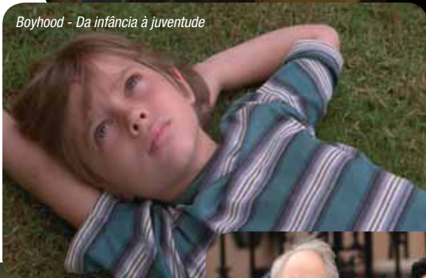
Boyhood - Da infância à juventude