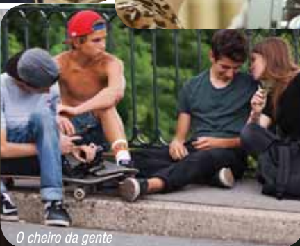
O cheiro da gente