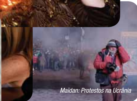
Maidan: Protestos na Ucrânia