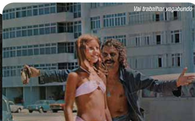
Vai trabalhar vagabundo