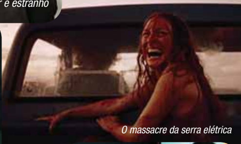
O massacre da serra elétrica