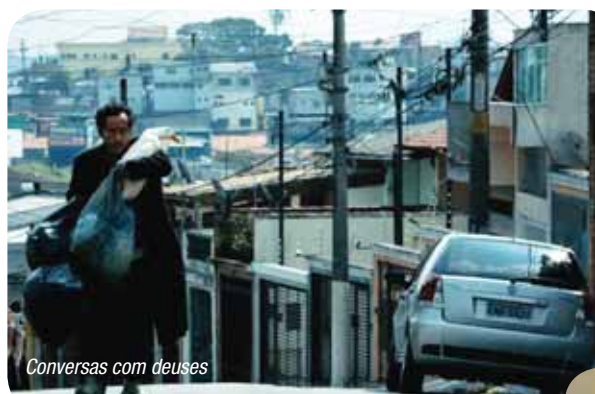
Conversas com deuses