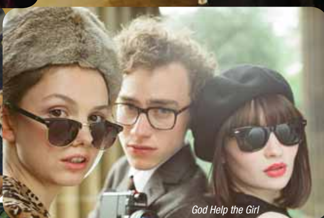
God Help the Girl